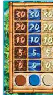
Ill. 2b : la situation du marché noir au début de la partie.