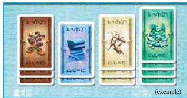
Ill. 2a : les actions non distribuées aux joueurs sont posées faces visibles à coté du plateau.